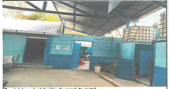
Suministro e instalación de canal de metal.

Observación: Si es necesario se pueden agregar hojas adicionales y actualizar el número de hojas.