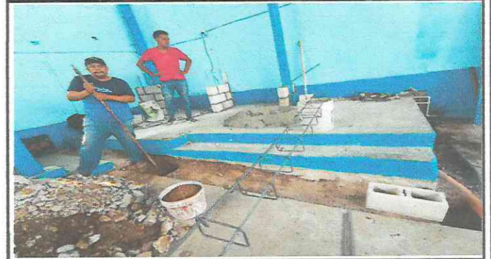
Foto 4: Remozamientos de paredes de cocina, suministro e instalación de tubería de agua e instalación de sistema eléctrico.