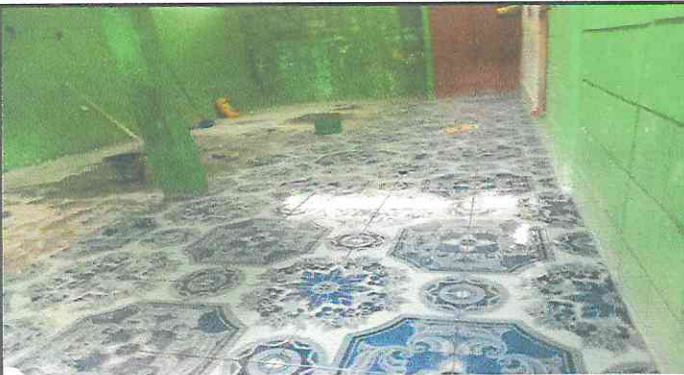
Foto 3: cambio de piso o loza de concreto a piso cerámico en aulas